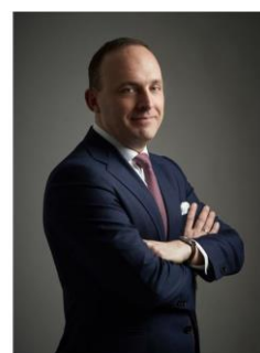
Thomas Wulf Generalsekretär EUSIPA

Thomas Wulf , der Generalsekretär der EUSIPA in Brüssel, stellte beim Jahresauftakt die hohe Mittelaufnahme der Notenbanken an den Beginn seiner Ausführungen. Gegenüber der Finanzkrise sei das Geldvolumen in Europa um das Zehnfache gestiegen, in den USA hingegen „nur“ um das 2,5-fache. Nicht nur die EZB, auch die EU und die nationalen Regierungen würden Geld aufnehmen. Die Frage sei wohl, meinte Wulf, ob das Covid-19 Relief Funding zeitlich begrenzt bleibe oder zur Dauereinrichtung im EU-Budget werde.